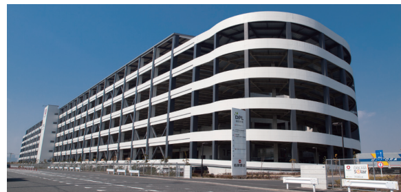
2016年(平成28年)2月 本社事務所を鶴見区大黒町DPL 横浜大黒へ移転。