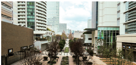
「みなとみらい21」の発展に寄与する創業の地「高島」