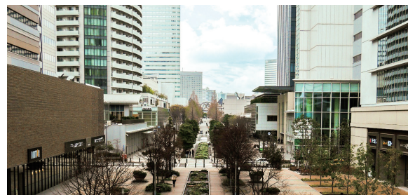
「みなとみらい21」の発展に寄与する創業の地「高島」